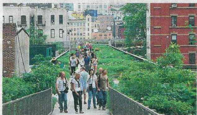
Нью-йоркская Хай-Лайн привлекает своей необычной задумкой множество туристов.

Сельское хозяйство и промышленность в нашем представлении чаще всего непримиримо разделены: промышленность прописана в городах, сельское хозяйство - в деревне. Промышленность всегда находится на острие инноваций, сельское хозяйство скорее покоится на традициях. Министерства и университеты у этих сфер тоже традиционно отдельные. Но сегодня во всем мире набирает популярность принципиально иной подход, объединяющий индустрию и земледелие.