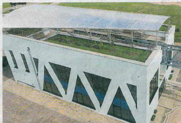
Важный элемент транспортной системы - транспортно-логистический узел, своего рода вокзал. Теперь без клубов дыма и с деревьями.