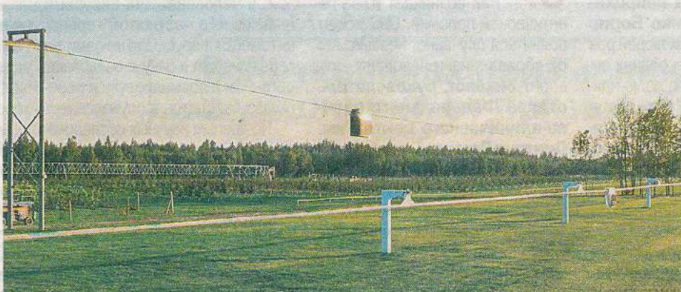
В ЭкоТехноПарке построены тестовые участки трех типов трасс. На крышах построек и прямо под эстакадами свободно растут цветы, кустарники и даже деревья.

Подход, который предлагают «Струнные технологии», хорош прежде всего своей комплексностью. Вместе с новыми дорогами будет поставляться гумус, на котором можно будет выращивать чистые от вредных веществ продукты. Сама по себе такая инфраструктура в перспективе должна стать основой для роста городов нового типа, ведь по ней могут перемещаться все нужные для этого ресурсы. Новые города должны будут стать удобнее для людей и безопаснее для природы - именно на это направлены усилия амбициозных разработчиков струнного транспорта.